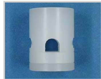
Fijación para sensor M18 - tubo D 5.0, Nylon