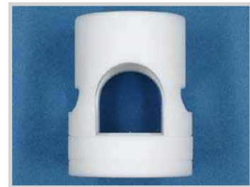
Fijación para sensor M30 - tubo 3/4", PTFE