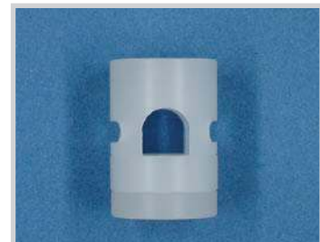
Fijación para sensor M18 - tubo D.6.5, Nylon